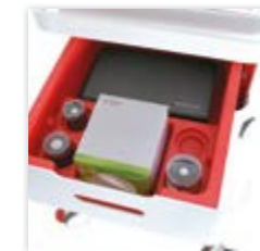
Geordnetes Zubehör durch vorgeformte Schubladeneinteilung