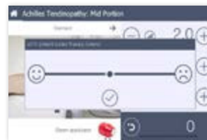
Datenbank der Patienten mit Behandlungsverlauf auf der Grundlage des VAS