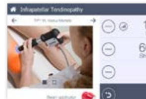
Visuelle Darstellung der Behandlungszone mit eventueller Schmerzausstrahlung bei der Behandlung von Triggerpunkten