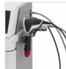
Praktisches Kabelaufhängungssystem für Ihre Handstücke