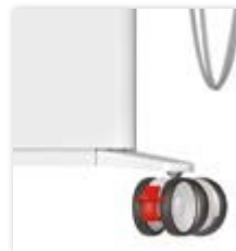
Dank der großen Räder schnell und einfach transportabel