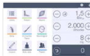
Neue Untermenüs: Auf der Grundlage des betroffenen Gewebes